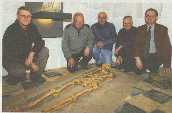
De Museumvrienden bij een van vondsten.

"Bij historische bronnen stond dit gebied al jaren gekend als het voormalige kloosterdomein van de paters Bogaerden, vanaf 1831 beter gekend als de Bogaardenkazerne in de Begijnenstraat in Diest. Met de tentoonstelling in het stadsmuseum willen we iedereen kennis laten maken met de resultaten van het archeologisch onderzoek én met de historie van het klooster vanaf de stichting in de 13de eeuw (1240) tot de uitdrijving van de paters bij de Franse revolutie in 1796. Daarna moest het klooster natuurlijk een nieuwe bestemming krijgen. Eerst werd er voor korte tijd een katoenspinnerij ingericht. Vanaf 1815 werd er een stadscollege ondergebracht, dat op