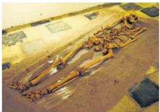
Enkele skeletten worden nu tentoongesteld.