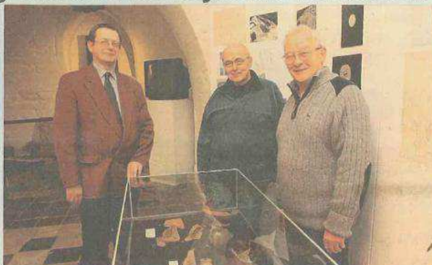
De vrienden van het Stedelijk Museum bij enkele van de archeologische vondsten.

Een zeventigtal eeuwenoude skeletten, veel aardewerk en prehistorische vondsten. Dat is de buit van de archeologische opgravingen op de voormalige Euro Shoesite in Diest. Je kan de unieke voorwerpen vanaf vandaag bewonderen op de tentoonstelling 'Verrezen Bogaarden' in het stadsmuseum De Hofstadt. De archeologen groeven op de site de restanten van een Bogaardenklooster op.